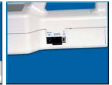
Данные легко загрузить в компьютер