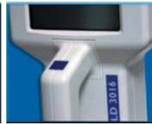
Удобная ручка с кнопкой запуска измерения