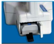
Сменная перезаряжаемая Li-ионная батарея