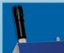
Датчик температуры/влажности (опция)