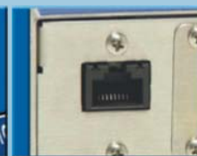
Коммуникационный разъём RJ-45