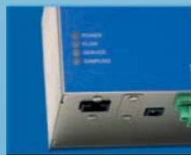
Индикатор рабочего режима