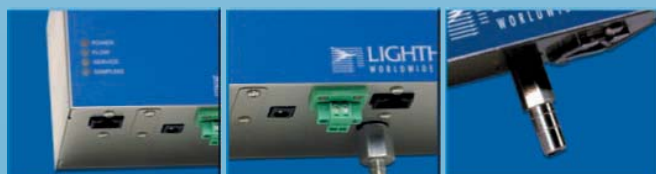
Индикатор рабочего режима